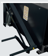
Élevateur de roue