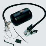
Kit gonflage tubeless (uniquement sur la version avec gonflage à pédale)