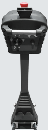
Not-Aus-Taster zur umgehenden Abschaltung der Steuerung.