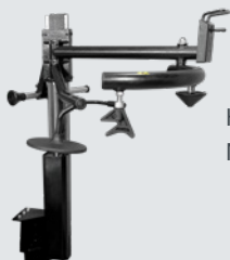
HPX-WS (für Megamount30)