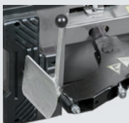
Wulstabdrücker für Motorradräder

Version mit Drehstrommotor: 0.8 - 1.1 kW 400V/50-60 Hz/3ph (2 speed) 7-14 rpm