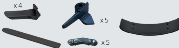
Satz von Schutzkappen aus Kunststoff