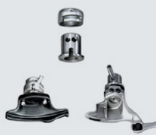
Schnellwechselsystem für Montagekopf, komplett mit Adapter und zwei Montageköpfen, einem aus Kunststoff und einem für erhöhten Speichen