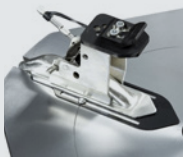
Satz von 4 Spannklaue für Fahrradräder mit 6"-23" Felge